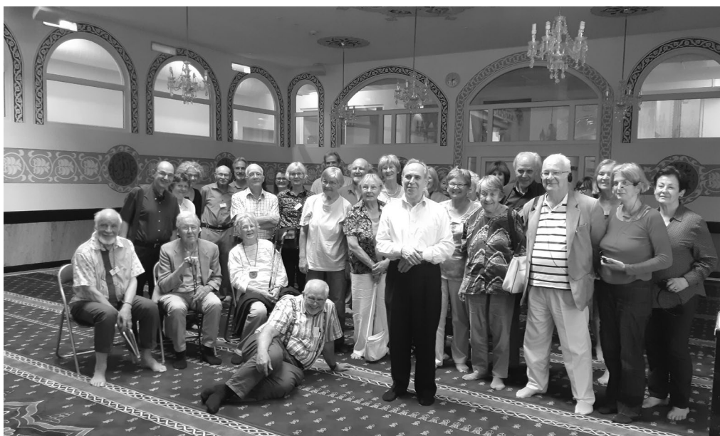
Tous ensemble – une AG, comme nous la souhaitons à nouveau ... (AG 2018 dans la Maison des religions à Berne)

Nous nous réjouissons d'emprunter de nouvelles voies avec vous et d'échanger, par écran interposé, certes, mais sans masques ! BR